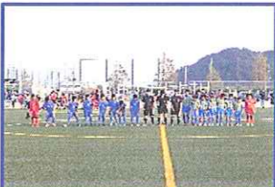
さあ、いよいよ決勝戦!