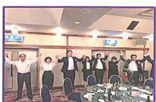
白シャツは、良いよネエ~!