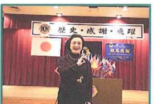
すごい、手話で委員会報告