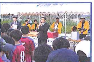
素晴らしい試合ばかりでした