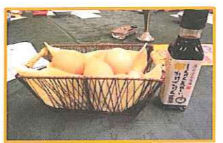
新米例会は、新米を卵かけごはん! 旨かった!!