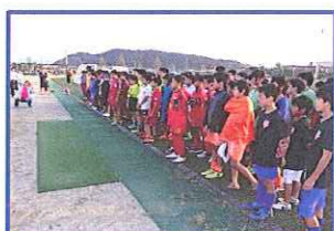
最後までお疲れ様でした