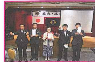
お誕生日おめでとうございます