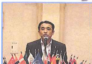
初例会 緊張の会長挨拶