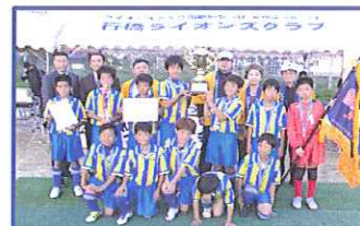
おめでとう! 優勝の豊前少年サッカークラブ