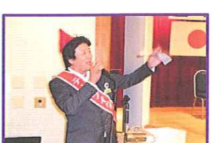
さわやかは、大変だ~!