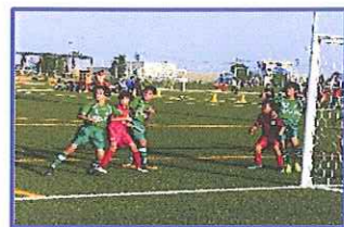
押すな、押すな、押すな、押すなヨ!