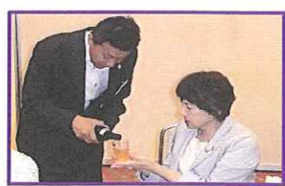
まー、良く来てくれました、さー飲んじょくれ!