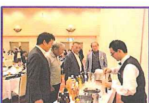
はよ作らんか、早よ~!