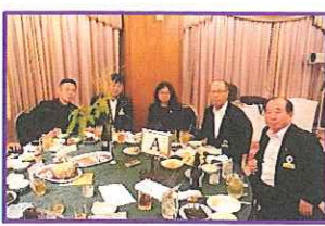
すすきの陰から、ひよっこりはんだ!