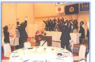
ローアチャ、元気よくせな チャーランそよ!!