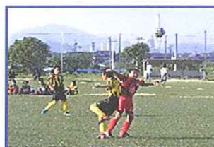
よ〜し、ヘディング! うんにや、俺のボールや!