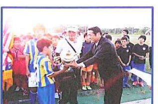
やったー、一番でっかいカップだ!