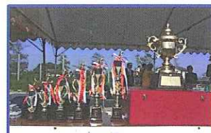
行橋ライオンズクラブカップ やっぱ右の大きいのがイネ!