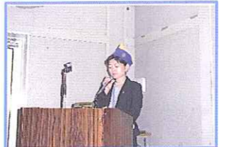
"ライオンとよばるる人" 時間が余らないようにf^_^;