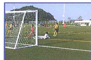
くっさつ、入れられた (-_-)