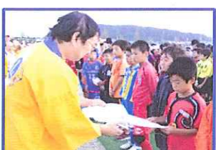
優秀選手賞の小港君 いや、L大港ジュニア