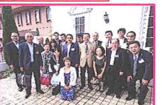
ガバナーと一緒に記念の1枚