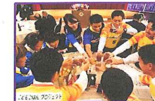
若さみなぎる、カンパイ~