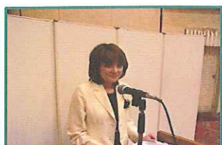
進行は私にまかせてねネ♡