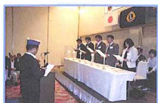
100%例会に出席することを制約します!?