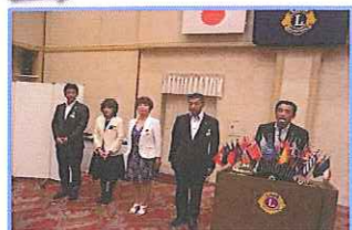
今期の5役です、ぐあんばります!