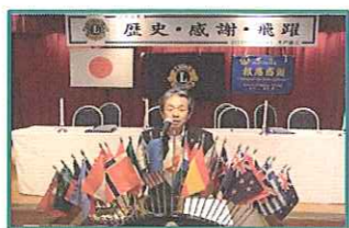
ライオンズの誓い! わしや還暦が近い!