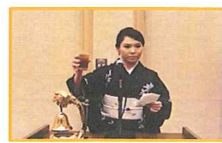
緊張しました。入会したばかりなのに、もう乾杯!