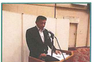
皆さんの拍手で承認されます。