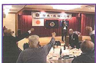
会長、ジャイケン弱え~!