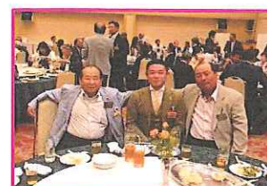
合同例会やけ会えたね!