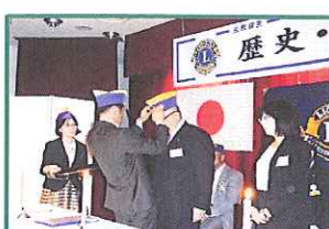
帽子が入らん、どうしよう(・o・;)