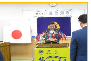
ライオンズの誓い、トイレも近い