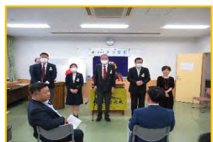
新旧役員の皆さん