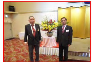
行橋LC会長・島原LC会長