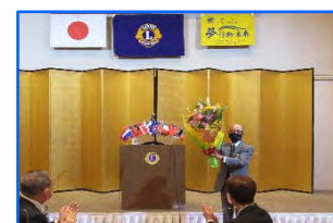
マイルストーン・シェアロン賞55周年 L伊藤