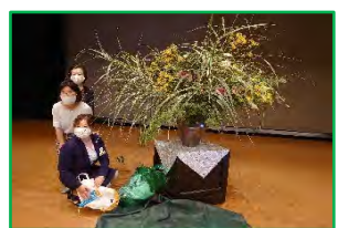
お花準備できました