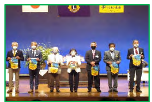
バナー交換して、ハイ。チーズ!