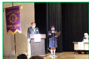
今日は私達二人で進行します