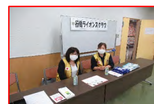
皆さん、お待ちしております! (場所: 商工会議所)