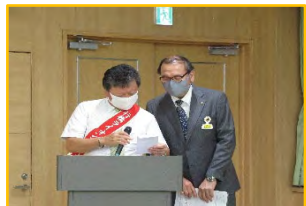
ねー、これなんち、読むかね? (笑)