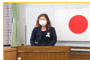
皆でそんなに見つめないで!