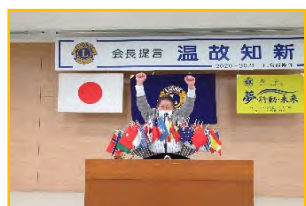
俺が、ライオンだ〜 うお〜