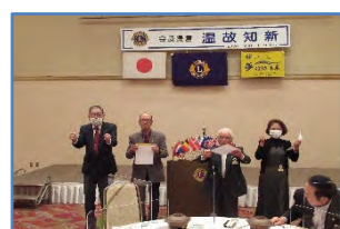
マイルストーン・シェアロン賞