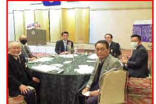
顧問の皆さんも、ハイチーズ