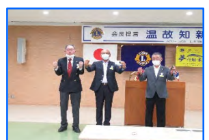
LCIF1000$ 献金L木戸(和) L長部