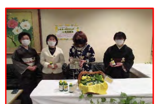
ネット・スタンド やってま〜す。