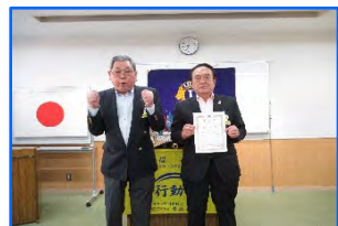
任命状 3R2ゾーンフェアパーソ L蓑干